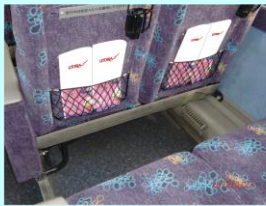
車内リーフレット