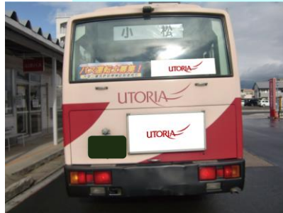
後部大板・後部ステッカー