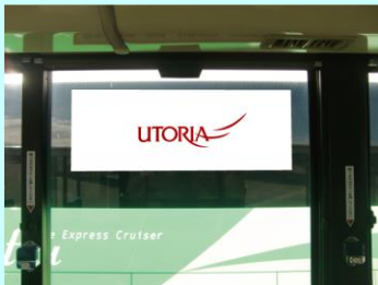
ウインドステッカー