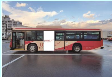
戸袋ロングシート