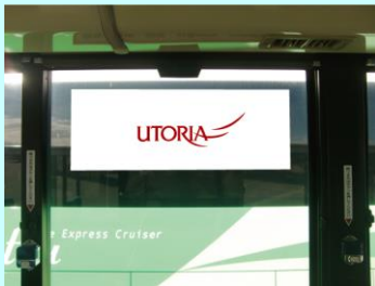
ウインドステッカー