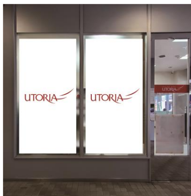
山形駅前バス案内所脇ガラス