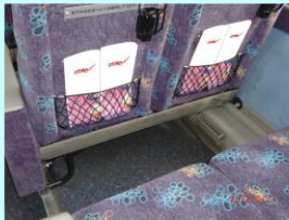
車内リーフレット