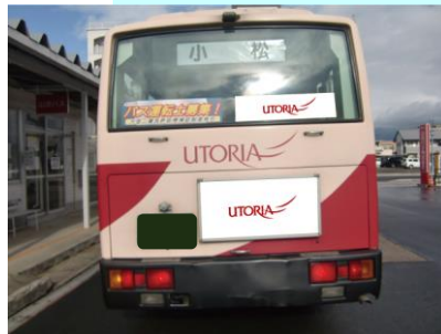
後部大板・後部ステッカー