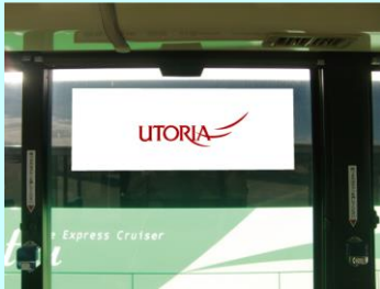
ウインドステッカー