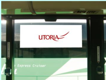
ウインドステッカー